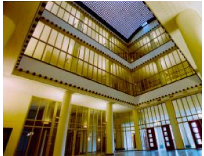
Puntegaalstraat 17-479, Rotterdam

Kwadrant 4: Transformatie naar andere functies. Bijvoorbeeld het oude deelgemeentekantoor Hillegersberg wordt kinderopvang (314.000 m 2 ).